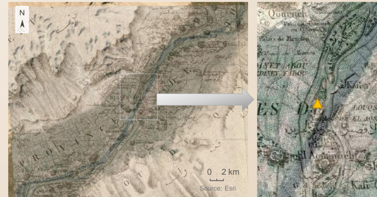
Figure 1. P. Jacotin, 1821-1829. Géoréférencer une carte géographique. Observations : Déplacements du Nil, présence de 5 îles, morphologie de la plaine alluviale.

• L'analyse de la cartographie disponible de la région s'avère décisive pour mieux comprendre les changements anthropiques et géomorphologiques survenus dans les derniers 200 ans dans la plaine alluviale et leurs temporalités.