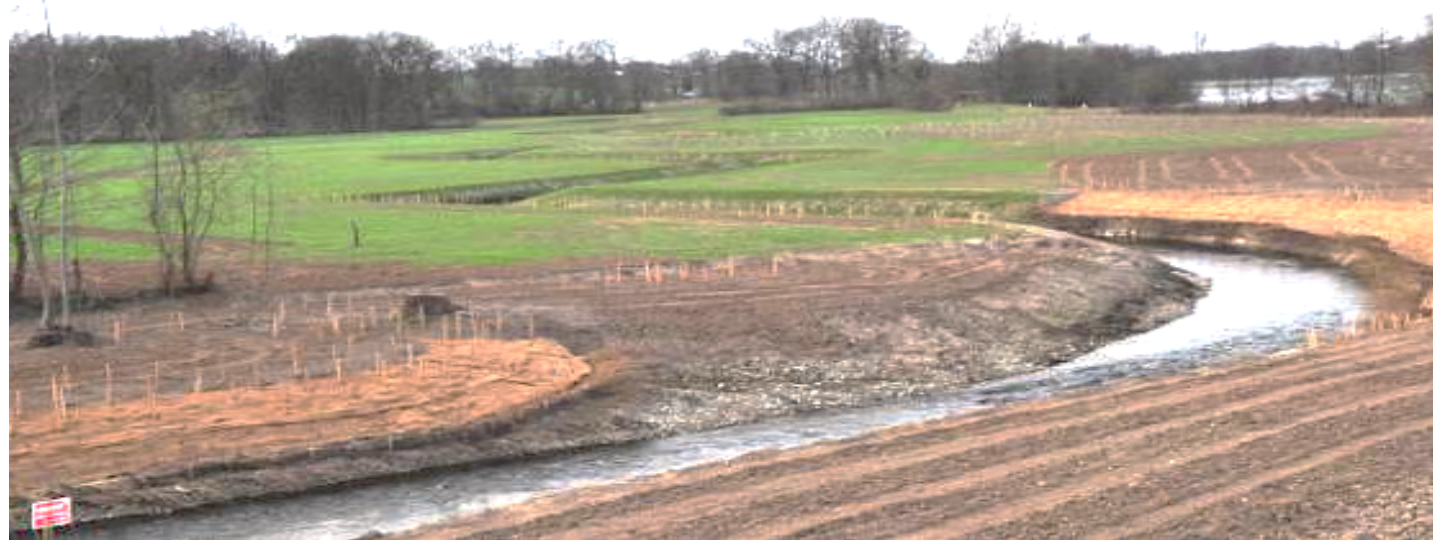
Travaux de restauration sur la Veyle en 2010 (Ain) Un nouveau lit a été créé afin de contourner une ancienne gravière. La maîtrise foncière a été essentielle pour la réalisation du projet (Bonnefond & Fournier, 2013)

Le bassin de la Loire, un territoire cohérent pour la thèse avec la présence d'un document de référence le SDAGE Loire-Bretagne, riche par la diversité des milieux qui le composent et historiquement dynamique en matière de restauration.