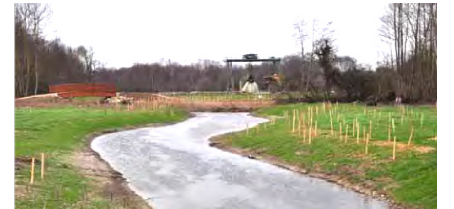
Travaux de restauration sur la Veyle en 2010 (Ain) (Bonnefond & Fournier, 2013)